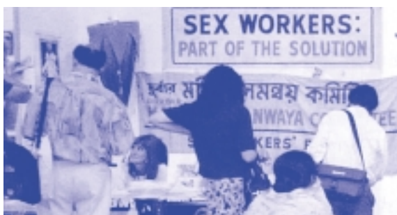
Trabalhadoras de sexo indianas: parte da solução

Existe pouca ou nenhuma evidência de que as trabalhadoras de sexo sejam responsáveis por espalhar o HIV. Algumas trabalhadoras de sexo têm tomado responsabilidade da sua saúde e seu bem estar.