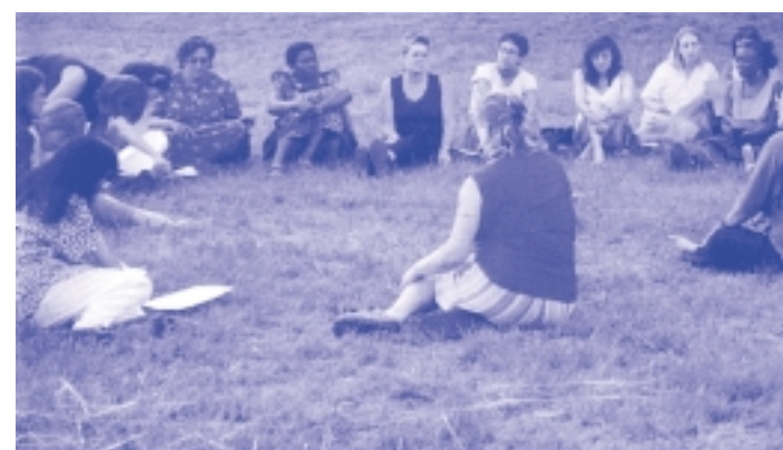
Lembramos as mulheres que nós perdemos

'Assusta-me a ideia de ficar doente neste momento. Não é o medo de morrer, é o processo de morrer. Não estou a ver bem as coisas. Estou a pensar fazer um testamento neste momento. Penso também quem será o executor. Está ficando cada vez mais difícil para mim suportar a doença. É o medo de adoecer e morrer. O peso é maior'.