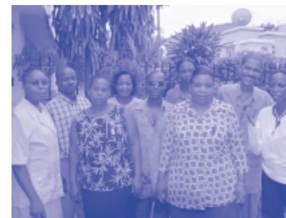
Associação Kindhimuka, Moçambique

Para mais informações sobre Direitos Humanos