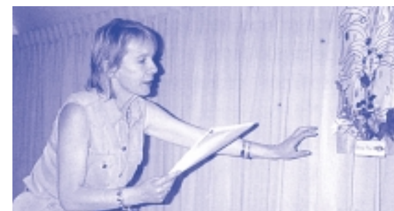
Leigh, Grã Bretanha

Algumas mulheres prisioneiras não têm sido capazes de escrever ou falar com os seus familiares sobre o HIV por falta de privacidade na prisão. As cartas eram lidas e as conversas postas à escuta. O staff da prisão conta aos outros e informações espalham-se pela prisão.